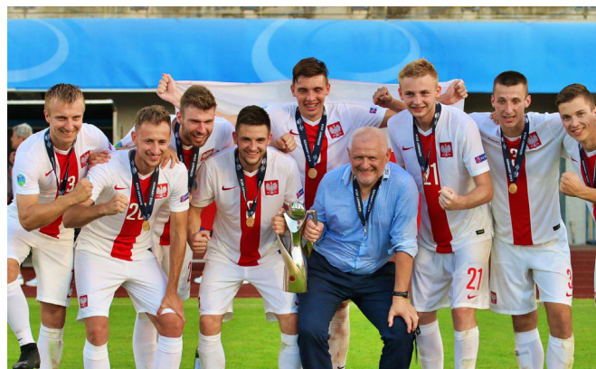
INNER UEFA REGIONS' CUP 2019

Zaledwie miesiąc przygotowań to niewiele, aby doprowadzić się do optymalnej dyspozycji. Intensywność treningów musi być wysoka, aby od pierwszego meczu grać na wysokich obrotach. Mając pełne zaufanie do sztabu szkoleniowego i patrząc po pierwszych meczach ligowych, można powiedzieć, że jesteśmy gotowi do walki o ligowe punkty.